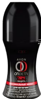
90067 Шариковый дезодорант, 50 мл