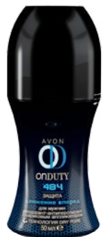
17896 Шариковый дезодорант, 50 мл