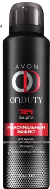
93940 Дезодорант-спрей, 150 мл