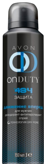
32219 Дезодорант-спрей, 150 мл